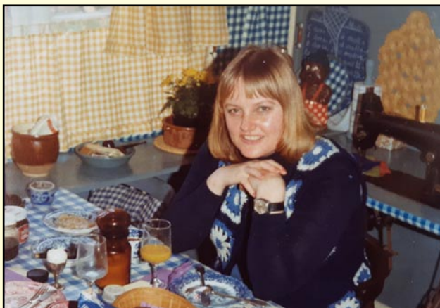
Morgenmad i studenterhyblen

Da jeg kort tid senere fik svar fra ministeriet, at jeg kunne starte i september, gik rejsen med tog til København. Det var en omvæltning at flytte fra landet til en hovedstad, men jeg blev ikke boende i Hellerup ret længe, da jeg skulle cykle til stationen, hvor to af mig købte cykler blev stjålet.