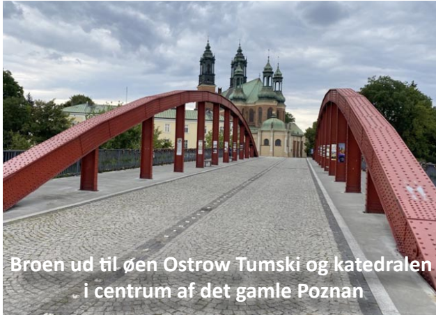
Broen ud til øen Ostrow Tumski og katedralen i centrum af det gamle Poznan

Fig. 10: Broen ud til øen Ostrow Tumski og katedralen i centrum af det gamle Poznan