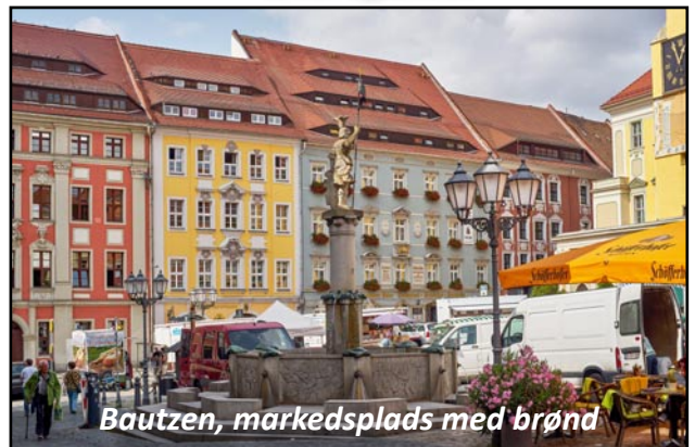
Bautzen, markedsplads med brønd

Bautzen/ Budyšin bliver nævnt første gang i 1002. Der er 42000 indbyggere. Byen har et tydeligt middelalderligt præg og er meget smuk med sine tårne og tinder. Bautzen har et fantastisk sorbisk museum, der informerer de besøgende om det sorbiske mindretal og om sorbisk kultur.