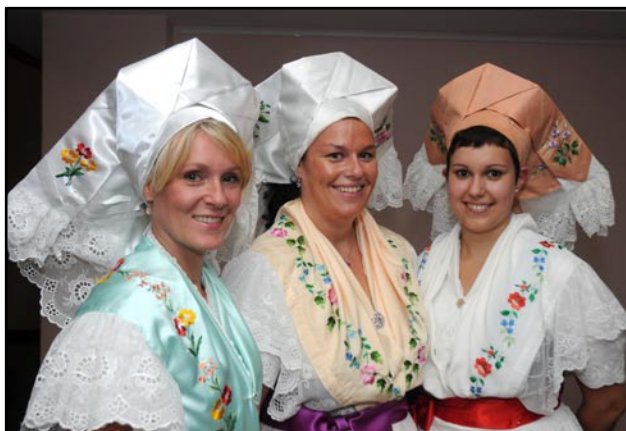
Tre sorbiske kvinder i deres smukke folke dragter

Ja, hele det nuværende Østtyskland beboedes af vendiske/obotrittiske/sorbiske m.fl. stammer, der langsomt overvandt af tysk adel og med tiden fortyskedes. Dog er der endnu et område i Østtyskland, Lausitz regionen, hvor der stadig bor en vendisk/sorbisk befolkning, der bekender sig til det sorbiske mindretal. De to store sorbiske byer i Lausitz er Bautzen og Cottbus.