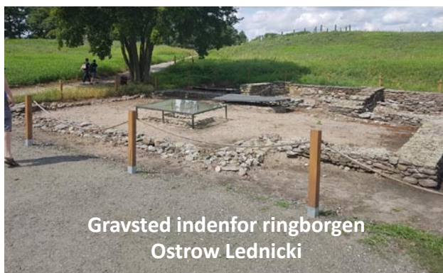
Gravsted indenfor ringborgen Ostrow Lednicki

Interessant var det at læse om den kæmpe af en kvinde, hvis skelet man havde fundet i en grav indenfor ringborgen, der var 2,18 meter høj! Interessant var det også på øens vestside at finde de planker og bjælker af de 5 meter brede broer, som formede øens 470 meter lange vestlige Poznan-bro indtil land helt tilbage i vikingetiden, og øens østlige 174 meter lange Gniezno-bro ved siden af færgepram stedet, som der ingen spor var tilbage af.