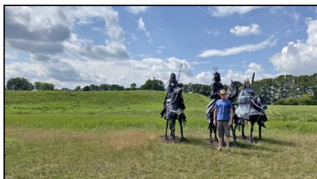
Mig selv foran ringborgen sammen med de figurer af riddere med krone for turisternes skyld, som også symboliserer den polske kongemagts placering her i de kommende århundreder.

Den polske ringborg er bygget ude på en ø i en sø som et forsvarsværk kaldet Ostrow Lednicki. Det var meget spændende ved selvsyn, og forventningens glæde er jo som bekendt altid den største, at blive trukket med en pram derud for at se, om der nu vitterlig skulle ligge en ringborg. Det gjorde der. På ovenstående billede kan den lige skimtes inde på land.