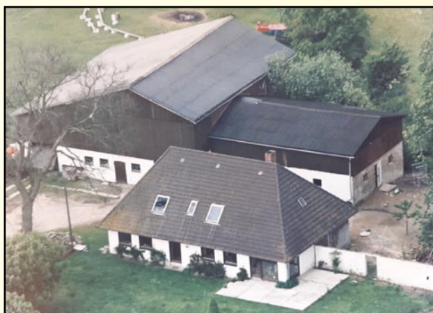
Vores gård i Großkönigsförde

Her blev vi boede til 1979/80, hvor den strenge vinter forsinkede vores nye flytning, som vi først kunne fuldføre sent i foråret. Vi ville nemlig flytte langt ud på landet på en nedlagt ejendom, hvor vi kunne holde dyr, og dette blev også fundet ved Kielerkanalen tæt ved skoven, og der var 2,85 ha jord fra »Kanalamt«. Så blev dyrene anskaffet, næsten alle slags, heste, får, svin, høns, ænder, gæs og to ammekøer, og dertil en ung tyr, som vi ikke kunne holde ret længe, da det blev for farligt. Det var lidt trist, når afkommet skulle til slagteren. Fjerkræet klarede vi selv.