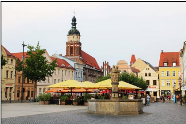
Det gamle torv/Alter Markt i Cottbus

Cottbus er en kredsfril by, der ligger i den tyske delstat Brandenburg. Den har knapt 100.000 indbyggere og er faktisk på størrelse med Flensborg.