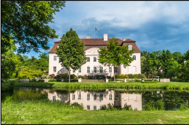
Det smukke slot Branitz i Cottbus

afstand mellem dem, så hvis man kun har kort tid, kan man sagtens få et indtryk af begge byer bare på en dag, hvis man er undervejs i bil.