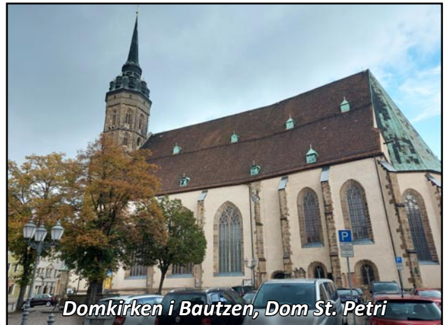
Domkirken i Bautzen, Dom St. Petri