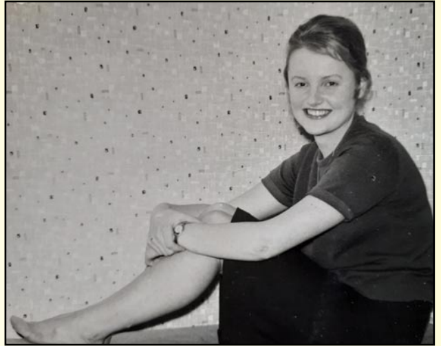
Ung pige med mod på livet

Jeg flyttede så til Østerbro, hvor en kollega havde formidlet et værelse til mig, der desværre var ret lille, men der var heldigvis et bruserum med varmt vand og et adskilt toilet. Jeg blev boende her i godt to år.