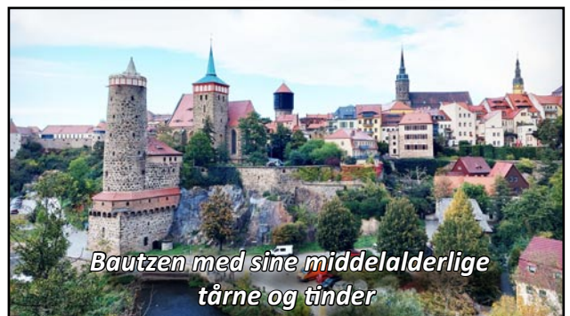
Bautzen med sine middelalderlige tårne og tinder