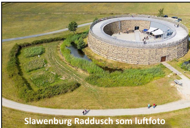
Slawenburg Raddusch som luftfoto

Vi forlod Polen på vores opdagelsesrejse ved grænseovergangen i Cottbus, der som "hovedstad" for det slaviske mindretal inde i Tyskland, sorberne, er to-sproget og er beliggende i det historiske område Lausitz, opkaldt efter de oprindelige lusatiere i bronzealderen. Vores mål var at se Slawenburg Raddusch som den ene af de 40 ringborge i området.