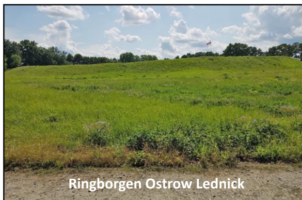
Ringborgen Ostrow Lednicki

borgen Ostrow Lednicki. Den er ca. 500 meter i omkreds, dvs. 159 meter i diameter. Til sammenligning er Aggersborgs diameter 240 meter, Borgeby 150 meter, Borgring 144 meter, Trelleborg (Sjælland) 136 meter, Trelleborg (Skåne) 125 meter, Fyrkat og Nonnebakken begge 120 meter. Volden var oprindelig 8 meter høj og kunne måske endda have været helt op til 12 meter høj (med palisader). Ringvolden er nu afbrudt, ligesom Aggersborgs ringvold af sin hovedgård, af højere vandstand i søen og tidens tand.