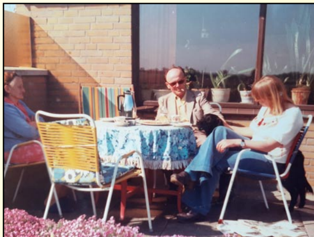
Hygge på barndomsgården i Sottrup

Men jeg var nødt til at rejse tilbage til København, da jeg i 1969 havde tilmeldt mig til Københavns Dag- og Aftenseminarium i Skovlunde. Bopæl fandt jeg i Rosengården ved Nørreport, og senere blev en ejerlejlighed til 50.000 kr. købt i Poppelgade, Nørrebro, hvor min senere mand hjalp mig finansielt, og en Velo-Solex (knallert) hjalp mig med at overvinde transportproblemet, men hvor var det koldt om vinteren, og da det meste af huset var bygget af træ i det 19. århundrede, var larmen enormt høj, og det blev solgt for 52.000 kr., da jeg havde fået et godt tilbud fra venner i Jyllingevej, Rødovre, hvor jeg kunne flytte ind sammen med to andre. Det var et udmærket sted. Senere så jeg i avisen, at en lille villa var til leje i Hybenvænget i Skovlunde, og her slog jeg til sammen med en studiekollega og min lillebror, der nu arbejdede i København. Her kunne jeg gå til fods til seminariet.