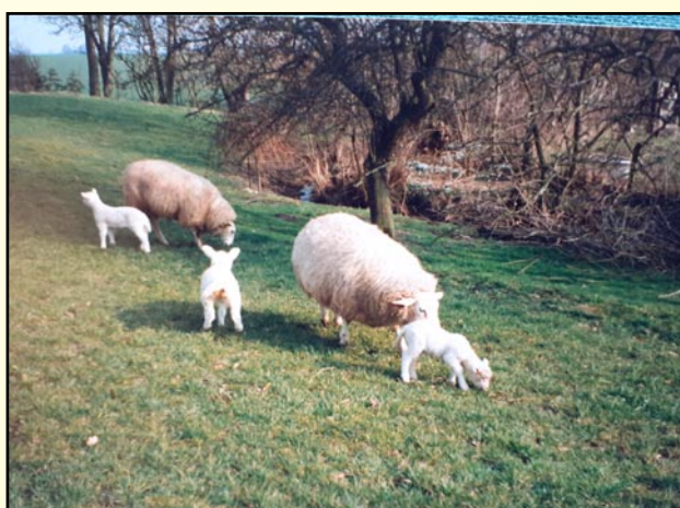
Heste, grise, køer og får hørte til min bondegård