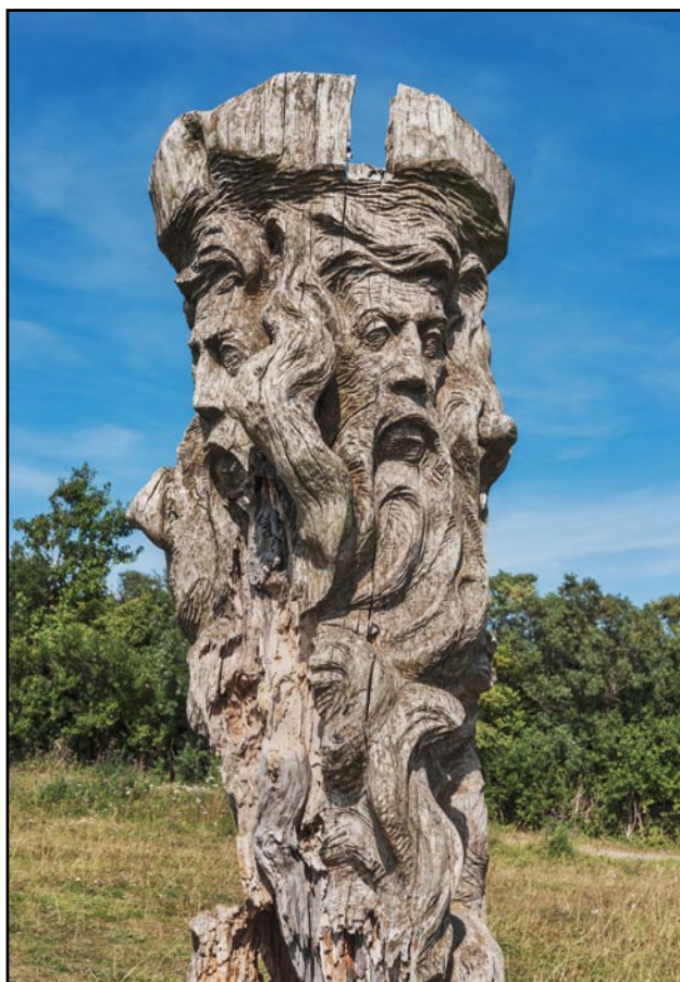
Ved Kap Arkona står nu denne spændende stele, der er fremstillet af en nutidig kunstner. Den oprindelige Svantevit-stele har muligvis set sådan ud.

Det sorbiske mindretal i hele Lausitz, Oberlausitz og Niederlausitz, der ligger i Sachsen hhv. Brandenburg, antages at have ca. 60.000 medlemmer, der vokser tosproget op, nemlig med både tysk og sorbisk som modersmål. Sorberne har ca. 25 grundskoler og to gymnasier i hhv. Bautzen/Budyšin og Cottbus/Chóšebuz.