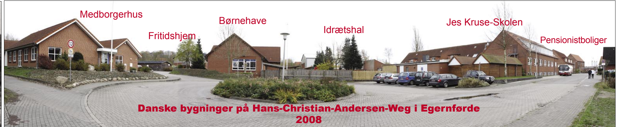
Danske bygninger på Hans-Christian-Andersen-Weg i Egerfnørde 2008