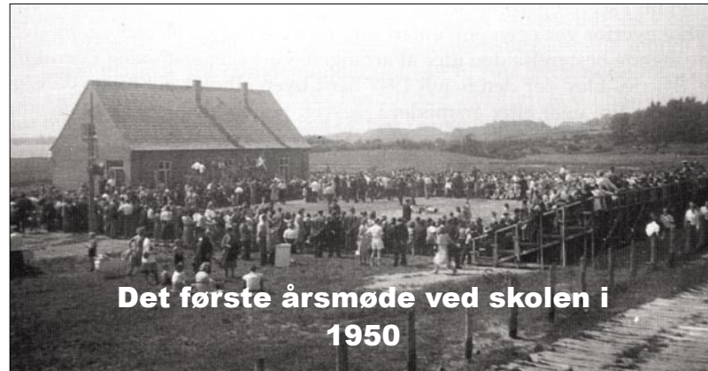
Det første årsmøde ved skolen i 1950