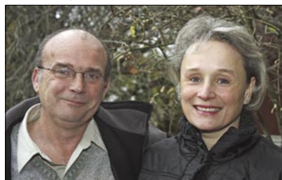
Familien Gibson-Avevor et liv i næstekærlighedens tjeneste.

(Gid, der fandtes flere sådanne familier).